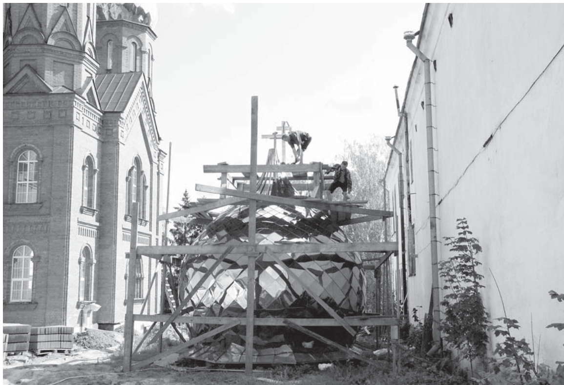
На этой площадке идёт работа по подготовке последних куполов для Никольского храма.