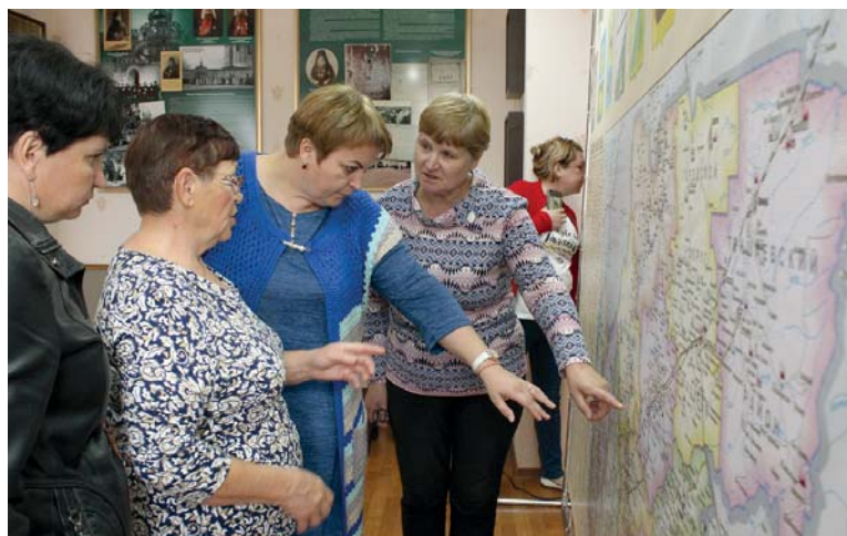
Гости из Варнавина посетили музей Городецкого Феодоровского мужского монастыря.

В 2019 году древнейшая обитель Нижегородской области – Городецкий Феодоровский мужской монастырь празднует 865-летие со дня основания и 10-летие со дня своего возрождения. Городецкий Феодоровский мужской монастырь был основан в 1154 году на месте обретения православной святыни – иконы «Феодоровская». В ноябре 1263 года в обители окончил свой земной путь святой благоверный князь Александр Невский, приняв иноческий постриг и схиму с именем Алексей. С тех пор монастырь стал особо почитаем русскими князьями, монархами и выдающимися общественными деятелями России. В 1927 году монастырь был закрыт, а древнейшие храмы России, находившиеся на святом месте, вскоре были разрушены.