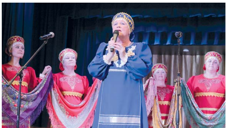
Ансамбль Богородского сельского Дома культуры «Сударушка» преподнес творческий подарок юбиляру.